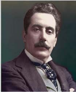
Giacomo Puccini 1858-1924

en Mills Music, de uitgever van het Fiorentino-manuscript.