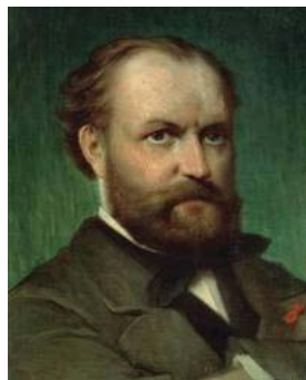
Charles Gounod 1818-1893

In het Gloria volgt op de woorden miserere nobis de aanroep Domine Jesu , om de indringendheid van het gebed te onderstrepen.