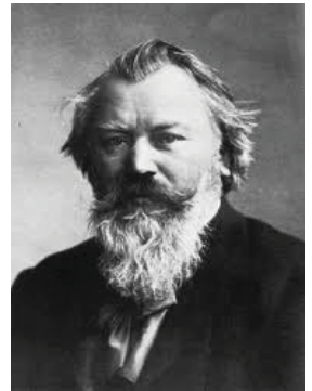
Johannes Brahms (1833-1897) tegen het einde van zijn leven

Johannes Brahms kwam al zijdelings ter sprake in het artikel over Robert Schumann. Brahms werd toen opgevoerd als vriend van het echtpaar Schumann