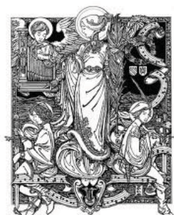
Saint Cecilia van Rome,

“Wie was Cecilia en waarom wordt zij in verband gebracht met