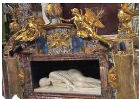
Graftombe van Saint Cecilia in Rome

Want dat was dus het gevolg. Veel componisten beschouwden Cecilia dus als beschermheilige of patrones.