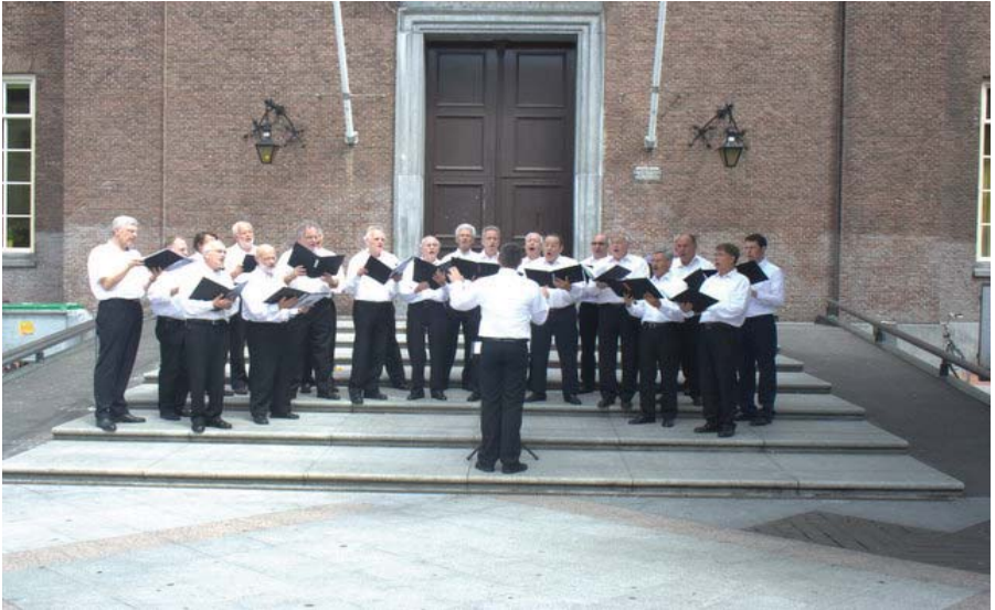
Een foto van het koor tijdens St. Jansdag 2008 op het plein voor de Hervormse kerk in de Kerkstraat

per direct gewenst: 4 leden in Tenoren 1, 3 leden in Tenoren 2, en 2 leden in Bassen 2. Met aandacht op de partijen Tenoren 1 en 2. In 2012 zullen er minimaal 9 nieuwe zangers nodig zijn. In de leeftijdscategorie van 40 tot 65 jaar. Daarnaast ook rekening houden met een tussentijds ledenverlies/verloop. Samengevat als volgt: