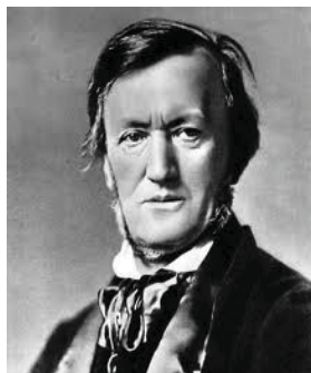
Richard Wagner 1813-1883

Zodra de lichten waren gedoofd, kroop hij achterin de loge en probeerde zijn hoesten te onderdrukken door een met bloed bevleekte zakdoek tegen zijn mond te drukken. Thuisgekomen ging hij naar bed en heeft dat niet meer verlaten. Zijn dochter verbood bezoek maar had zelf geen tijd om zich om haar zieke vader te bekommeren, vanwege het festival. Zelfs zijn leerlingen werden buitengesloten. Na een aantal eenzame dagen, ging Liszt sterk achteruit. Op de nacht van 31 juli kreeg hij last van een heftige schudkramp en kwam hij