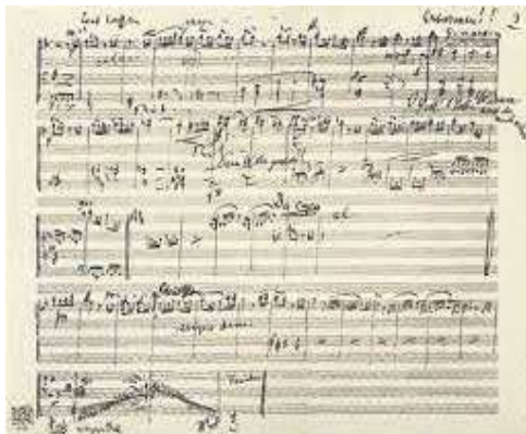
Partituur van Mahler.

deed het orkest geïrriteerd alsof ze het werk uitvoerden, maar produceerden ze feitelijk geen enkel geluid meer. Tóen pas was Beethoven zufrieden! Kortom: de man had alle partijen in zijn hoofd en dirigeerde eigenlijk wat hij meende of wilde horen.