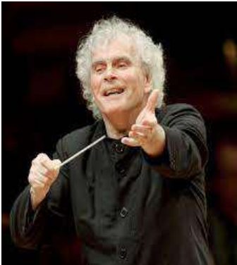
Sir Simon Rattle

Wanneer ik zie wat het ons enigszins muzikaal geofefende koorzanger aan inspanning kost om de partituren van de in te studeren werken onder de knie te krijgen, wordt tijdens het programma Maestro de indruk gewekt dat het allemaal niet zo moeilijk is. Neem nou als voorbeeld de partituur van een Mahler-symfonie. Deze is zelfs voor een geofefende dirigent een hele klus om helemaal te doorgronden en te beheersen. Het duurt