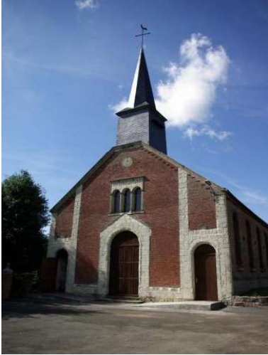
Exterieur Kerk in Lemé

U krijgt voor vertrek nog de nodige gegevens over deze reis en waar u aan moet denken aangereikt.